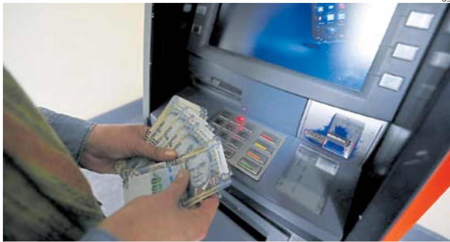
Retiros de efectivo. Son caros (su tasa de interés llega a 127%). Pese a ello, crecieron 64% en últimos dos años.